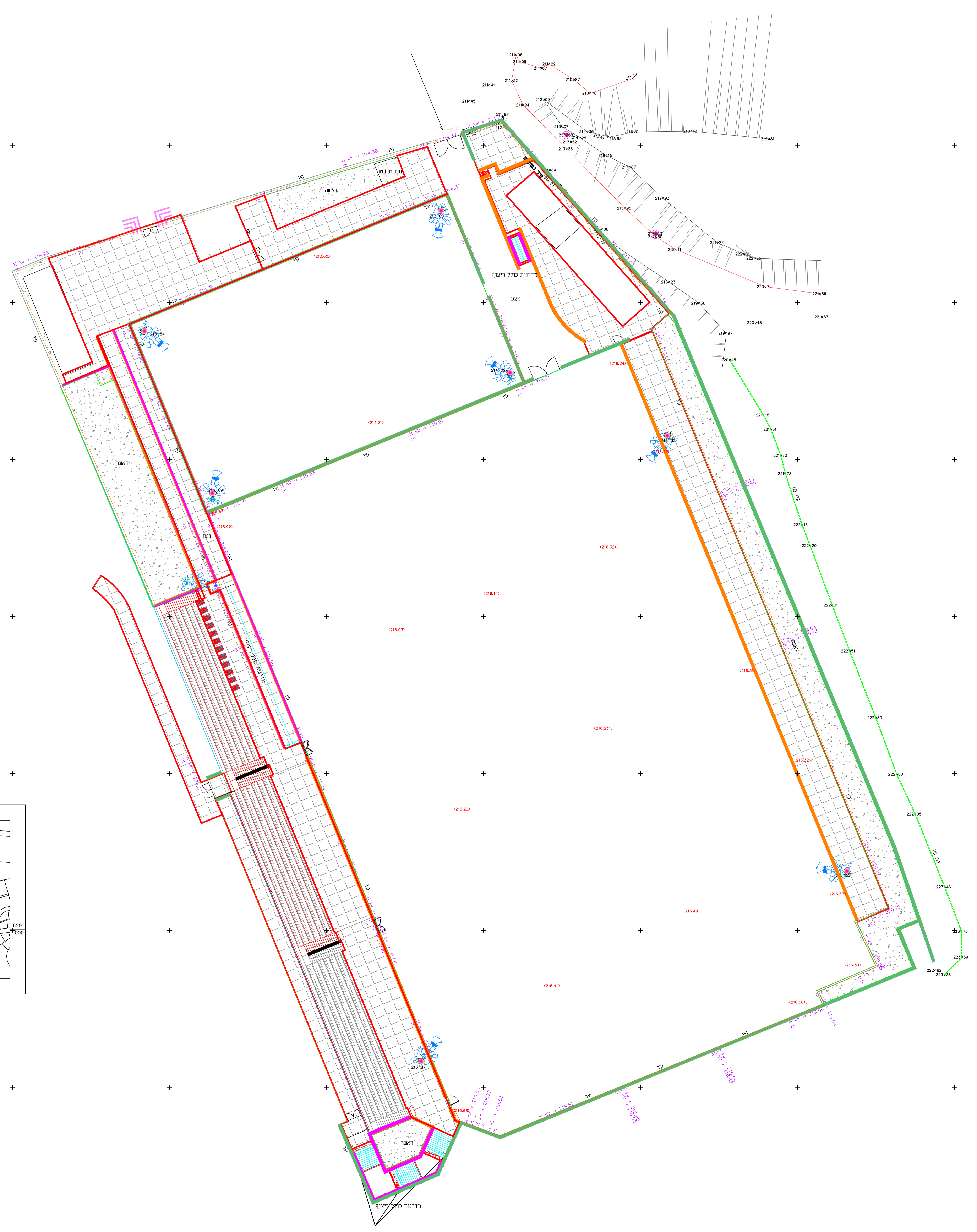
תרשים סביבה בקני"מ 1:5000